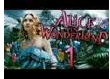
Película Tim Burton-2010