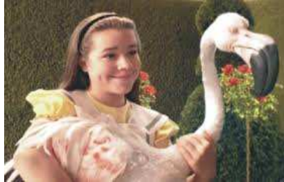
Película TV 1999