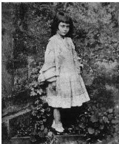
Retratos de la niña Alice Liddell

Su éxito llevo al autor a publicar una segunda parte: Alicia a través del espejo .