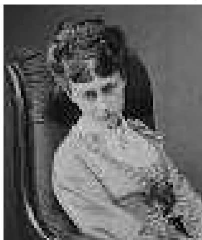
Alice Liddell a los 18 años