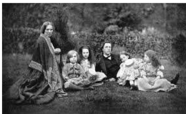
Lewis Carroll con la familia Macdonald