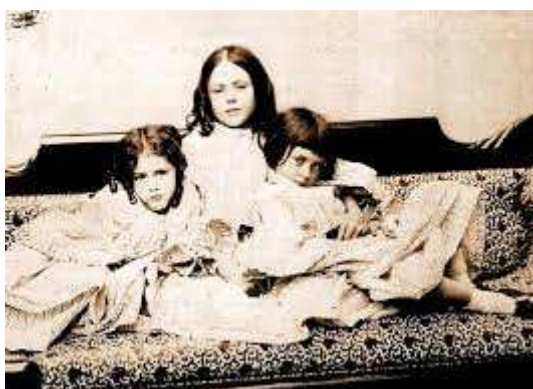
Las hermanas Liddell( Lorina, Edith y Alice)