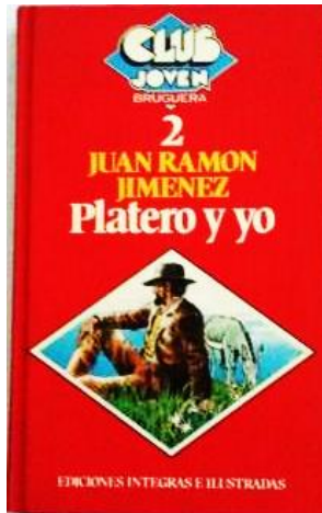
Ilustración de Isidro Monés. Tiene tapas duras, en tela y en color. Diseño de Sulé-Spagnuolo