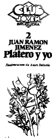
Ilustración de Asun Bazolga en blanco y negro.