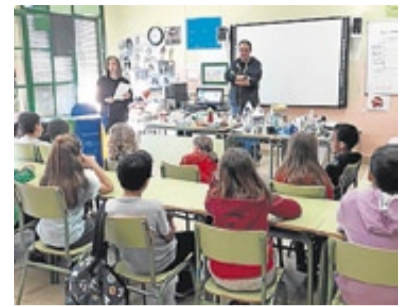
TALLER EN EL COLEGIO DE GRAÑÉN.

—Me gustaría dedicarme a algo relacionado con la escritura, concretamente al periodismo. ≡