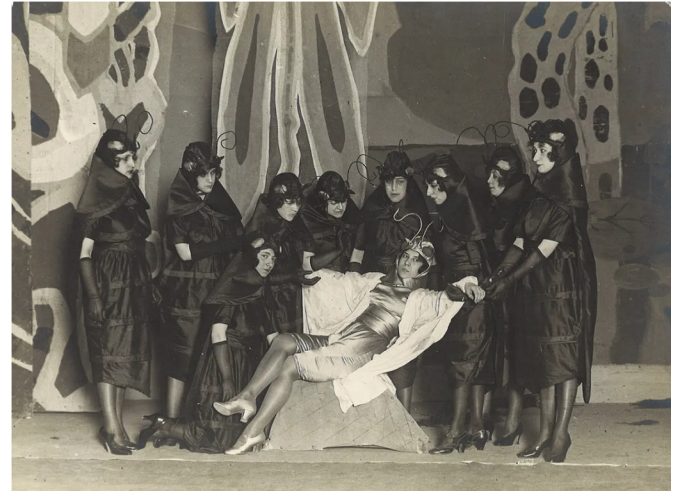
El maleficio de la mariposa.