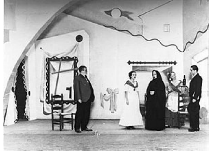
Bodas de sangre , representación teatral.