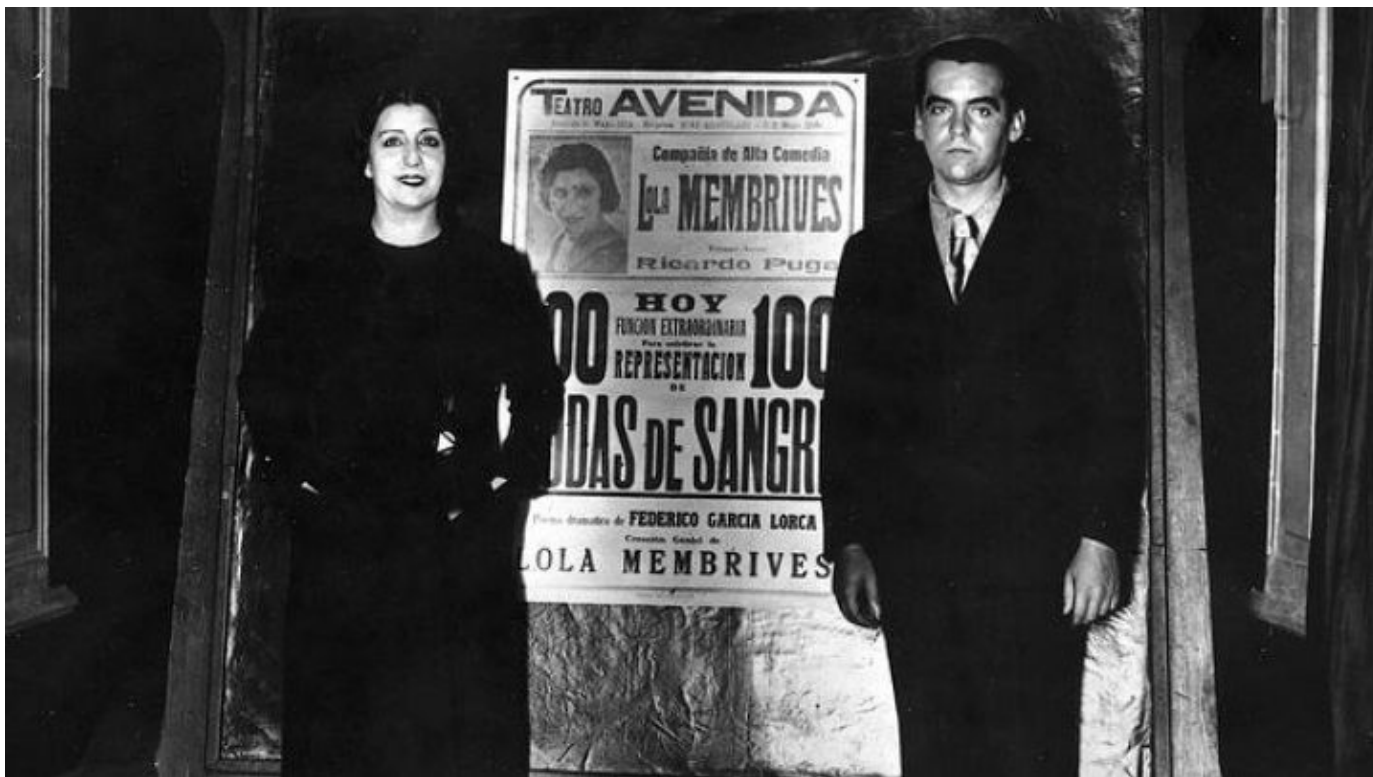
Federico García Lorca, gira por América.