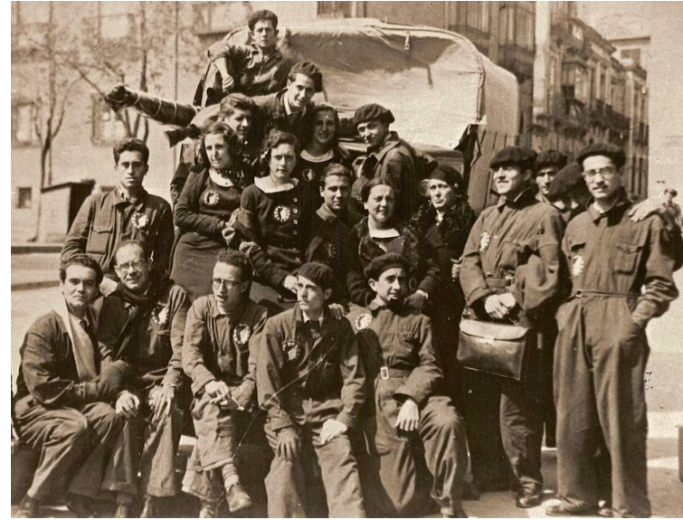
La Barraca, Compañía de Teatro Universitario.