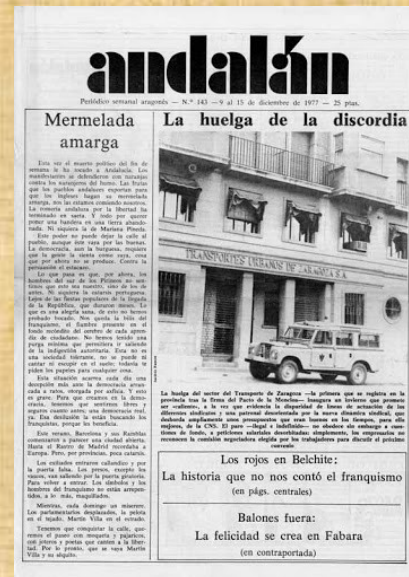
Revista Andalán , fundada en 1972.