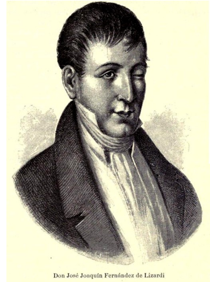
Don José Joaquín Fernández de Lizardi