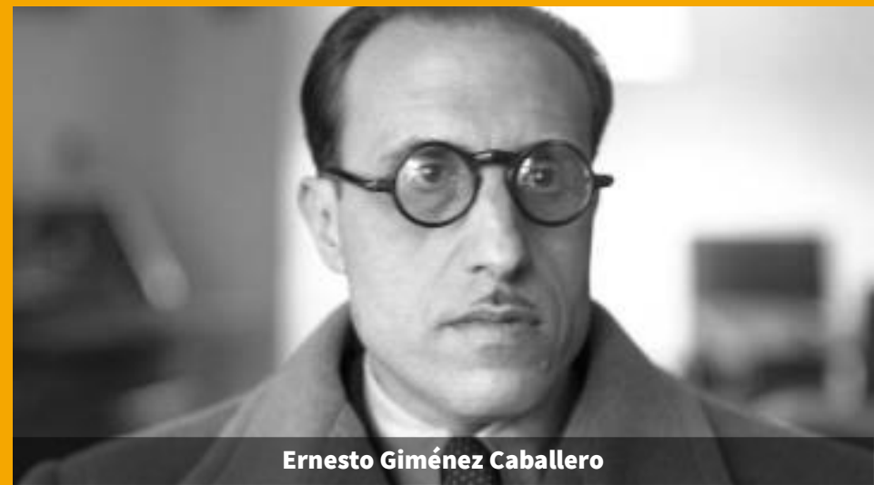
Ernesto Giménez Caballero