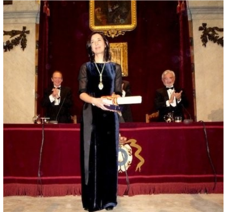
Discurso de recepción en la Real Academia Española