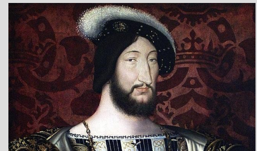
Francisco I de Francia