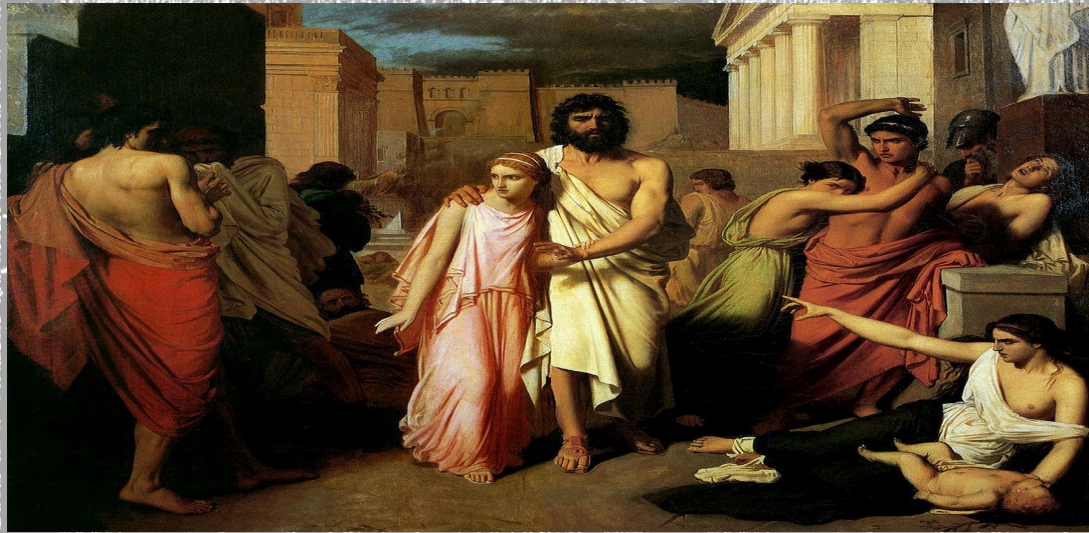
Imagen de Antígona con su padre Edipo abandonando la ciudad de Tebas, siglo V a.C.