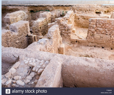
Plaza de la fruta

- Según historiadores, Balmis nació el 2 de diciembre de 1753 en la Plaza de la fruta , detrás del ayuntamiento de Alicante y fue bautizado como Francisco Antonio tres días después en la parroquia de Santa María de Alicante.