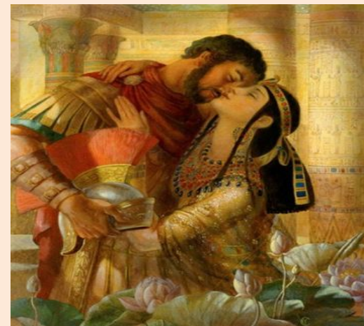
Cleopatra y Marco Antonio