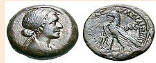
Cleopatra en una moneda de 40 racmas del 51-30 a. C.