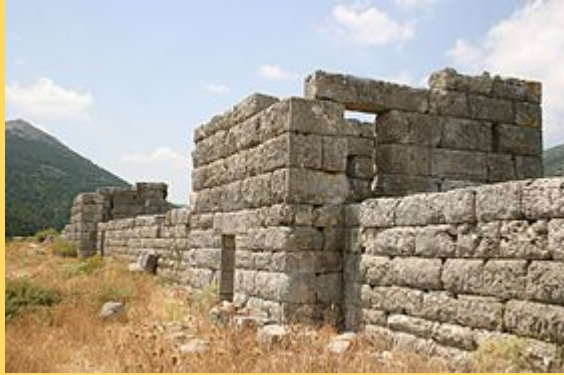
Restos de fortaleza de Eleuterias (pueblo donde nació Mirón)